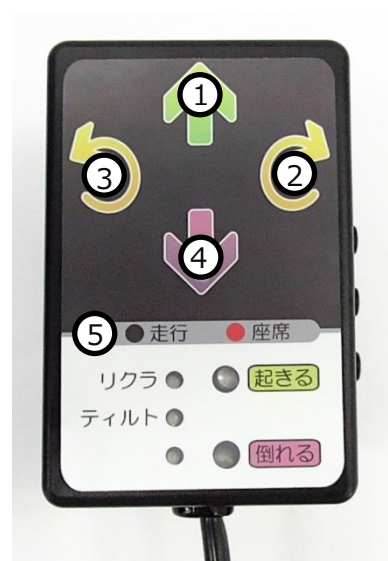
図9. モード表示エリアのスキャン

多様入力コントローラの電源トグルスイッチを「走行・座席・切」の3段階とした際に、「座席」に切り替えると自動的にSOIDが座モードとなります。トグルスイッチが「座席」となっている時は、機能選択エリアでのスキャンにモード表示エリアが含まれなくなり、SOIDの操作で走行モードに切り替えることはできません。トグルスイッチを「走行」に切り替えると自動的に走行モードとなり、モード表示エリアを活用できます。