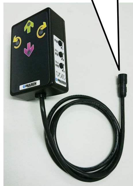
図 5. 全体外観