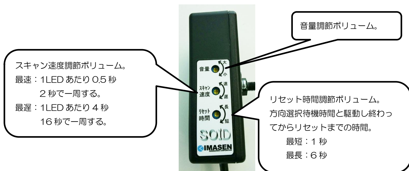
図10. 各調整ボリュームと機能