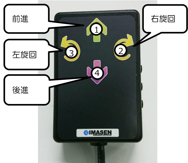
図7. 右振り設定におけるスキャン順