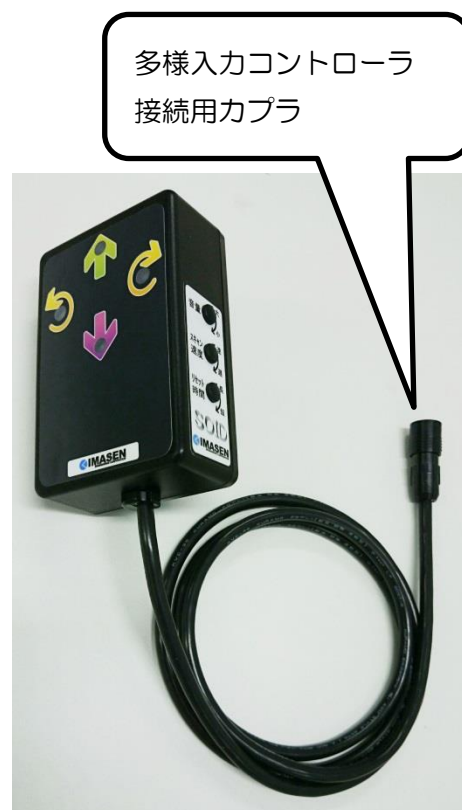
図 4. 右側面外観