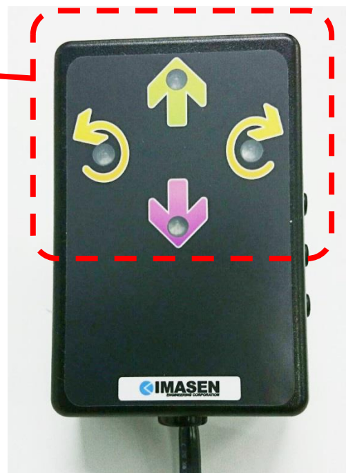
図 2. 正面外観（走行のみ車種用）