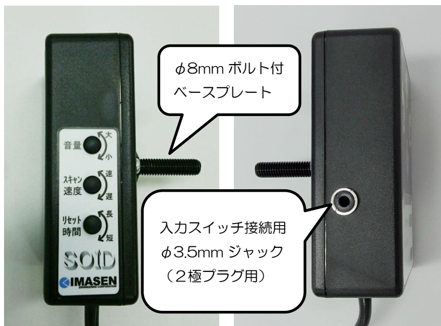
図 3. 左側面外観